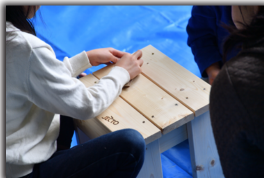
2017年4月開催「コンクリートまつり」