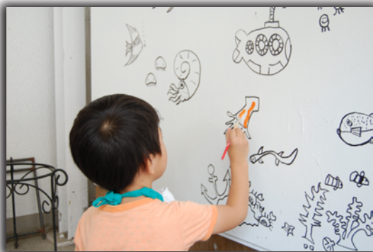
2016年8月開催「夏休み工作教室」