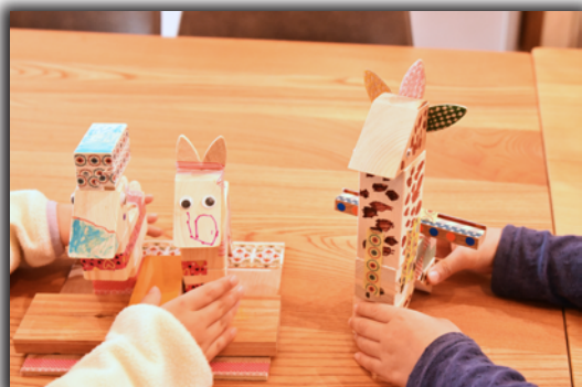
2019年4月開催「コンクリートまつり」